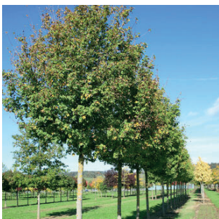
Acer camp Elsrijk