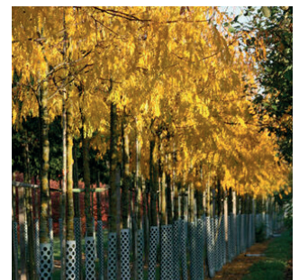
Gleditsia tri Sunburst