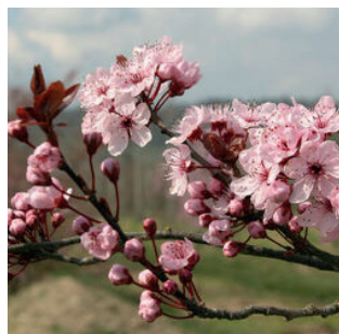
Prunus cerasif Woodii