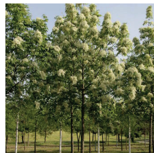
Fraxinus orn Louisa Lady