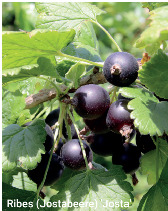
Ribes (Jostabeere) Josta

Die buschig wachsenden Johannis- und Stachelbeeren erfordern bei Pflanzungen in der Reihe einen Abstand von 120 bis 140 cm, Jostabeeren einen solchen von 150 bis 200 cm. Werden mehrere Reihen gepflanzt, so ist zwischen diesen ein Abstand von 180 bis 250 cm (Jostabeeren) einzuhalten