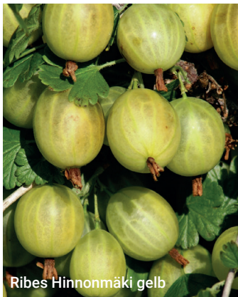
Ribes Hinnonmäki gelb