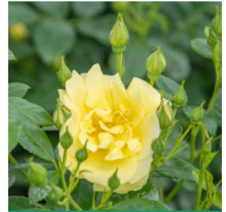
Rosa 'Loredo®' ADR 2001