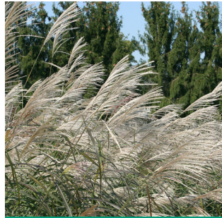
Miscanthus sinensis 'Silberfeder'