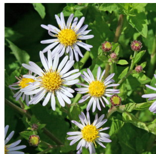
Aster ageratoides 'Asran'