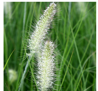
Pennisetum alopecuroides 'Hameln'