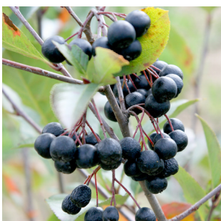
Aronia prunifolia 'Viking'