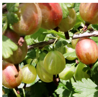
Ribes uva-cri 'Captivator'