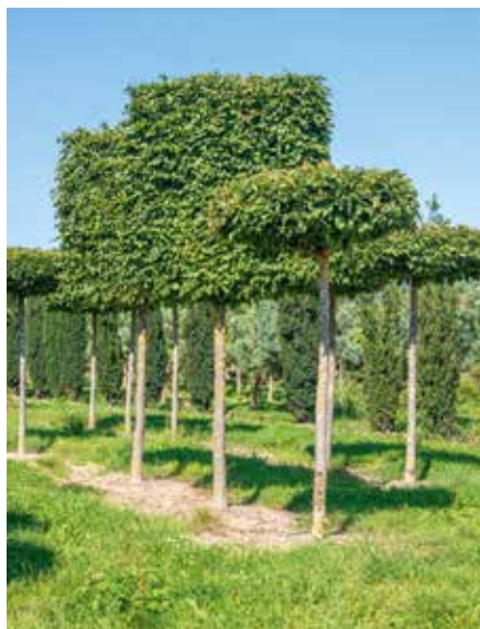
Carpinus betulus Spalier und Parrotia persica Dach