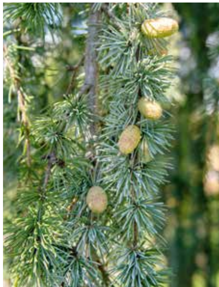
Cedrus libani Glauca Pendula Blüte