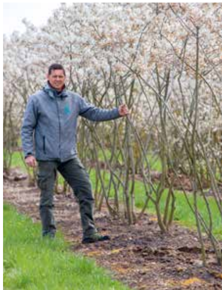
Amelanchier lamarckii Schirm