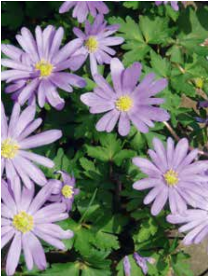
Anemone blanda Blue Shades