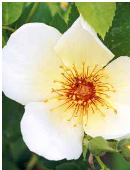
Rosa Golden Wings