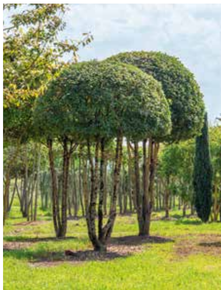
Acer campestre Elsrijk SOLB Schirm