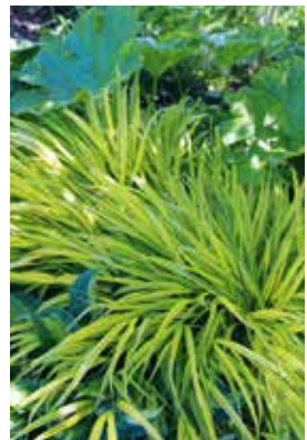
Hakonechloa macra Aureola