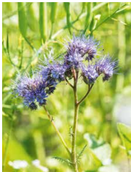
Gründung mit Phacelia