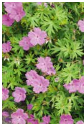
Geranium Tiny Monster