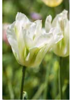
Tulipa Spring Green