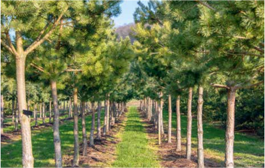
Pinus sylvestris HOB in Kultur