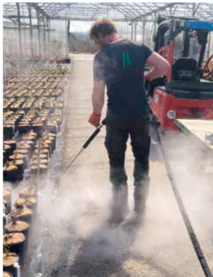
Umweltschonende Beikrautvernichtung mit Keckex