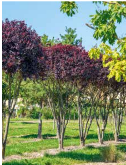
Prunus cerasifera Woodii SOLB Schirm