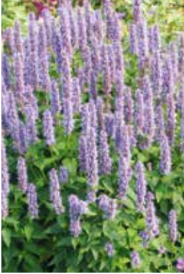
Agastache Blue Fortune

Standort: mässig trockene bis frische Böden, lehmhaltige Böden