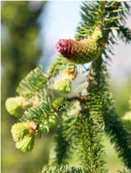
Picea abies Inversa