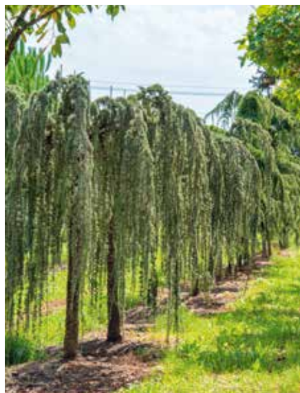
Cedrus libani Glauca Pendula