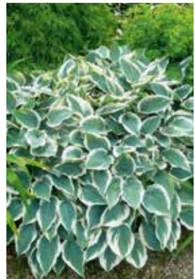
Hosta El Nino