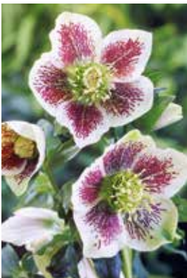
Helleborus orientalis White Spotted

Standort: Schattig, frischer Boden, wenig Wurzelndruck