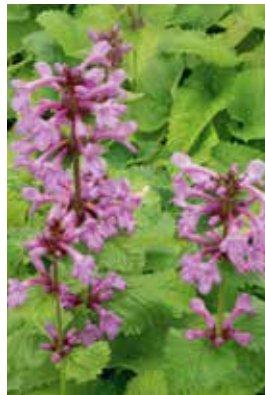
Stachys macrantha Superba