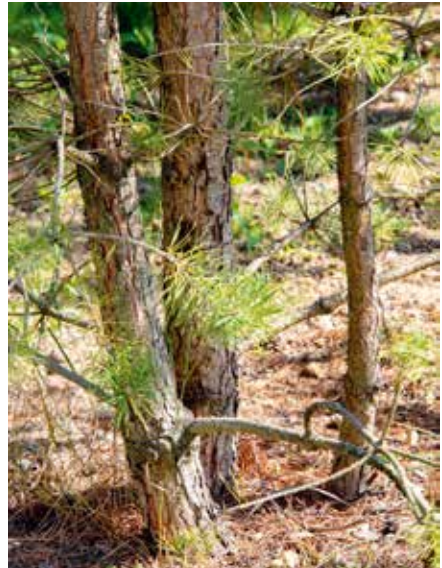
Pinus sylvestris SOLB MSTB