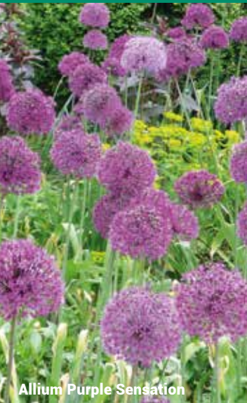
Allium Purple Sensation