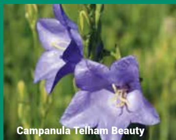
Campanula Telham Beauty