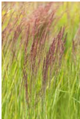
Calamagrostis acutiflora Karl Foerster