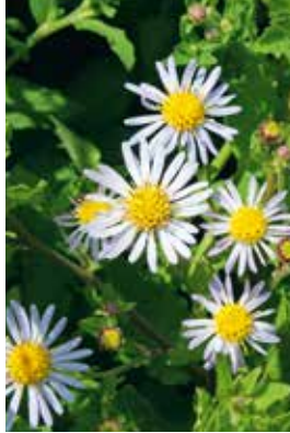
Aster ageratioides Asran