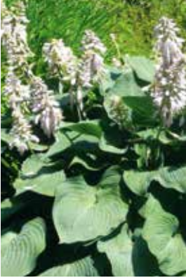
Hosta sieboldiana Elegans

Standort: halbschattig, absonnig bis schattig, frischer bis zeitweise trockener Boden