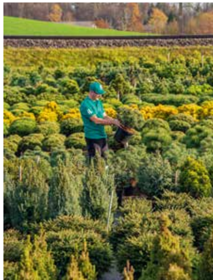
Nadelgehölze im Container