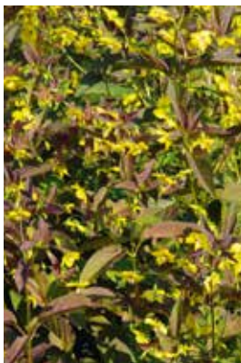
Lysimachia ciliata Firecracker