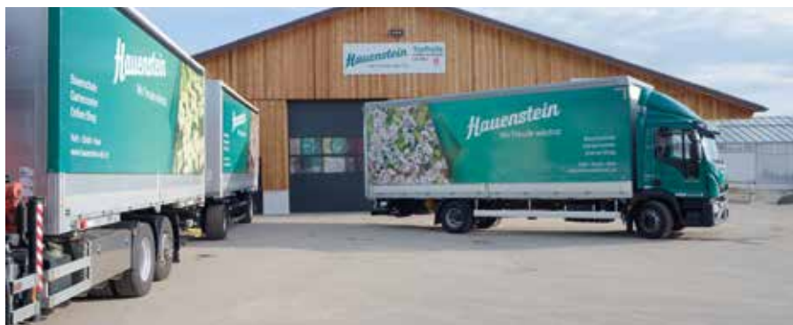
Lastwagen von Hauenstein AG

Von Dezember bis Februar finden die Transporte nicht gemäss obigem Plan statt. Wenden Sie sich bei Fragen bitte an unser Verkaufsteam.