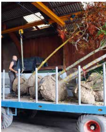
Kraneinsatz beim Verlad

Zuverlässiger Lieferservice (Schweiz/Liechtenstein)