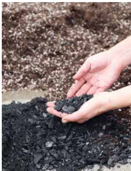
Pflanzenkohle im Einsatz