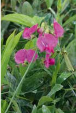
Lathyrus latifolius Red Pearl

Standort: Sonnig bis halbschattig, guter Gartenboden, mässig trocken