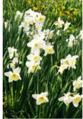
Narcissus Ice Follies