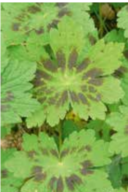
Geranium phaeum Samobor

Standort: Sonnig, trockene bis frische Böden, ohne Staunässe