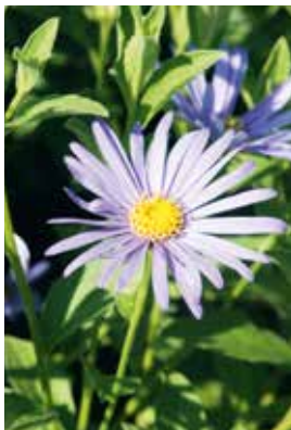
Aster frikartii 'Mönch'

Standort: Sonnig bis halbschattig, mässig trockener bis frischer Boden