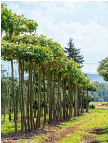
Platanus hispanica MSTB Schirm