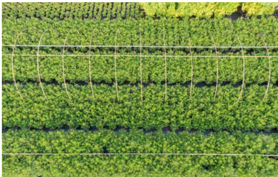
Prunus lusitana Angustifolia