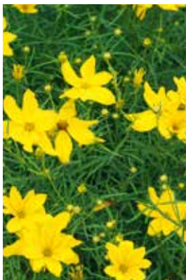
Coreopsis verticillata Grandiflora