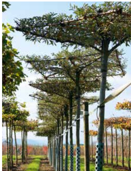
Elaeagnus multiflora Dach