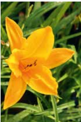
Hemerocallis Norton Orange

Standort: Halbschattig bis absonnig, frischer, nährstoffreicher Boden