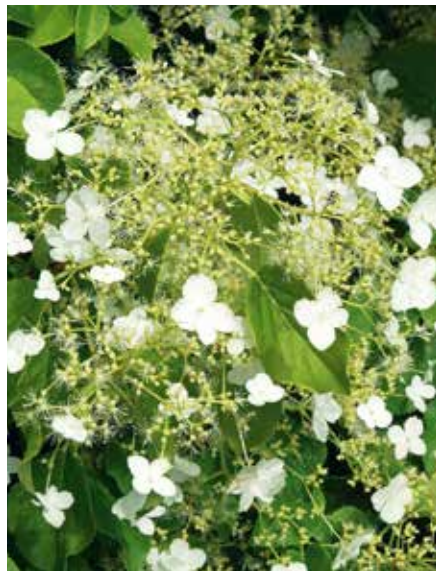
Hydrangea anomala petiolaris