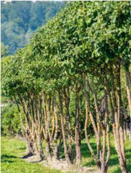
Chionanthus retusus SOLB Schirm