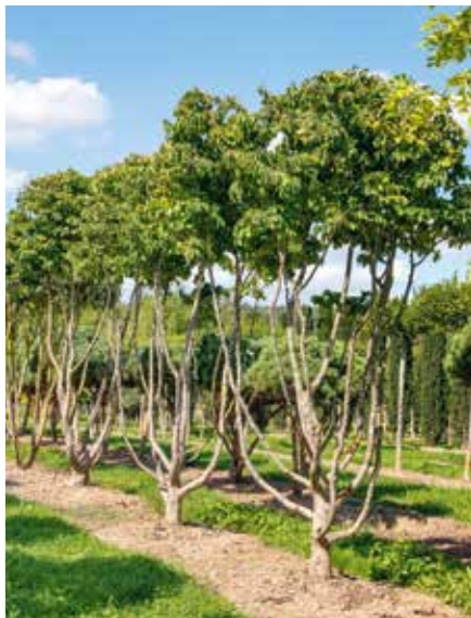
Parrotia persica SOLB Schirm