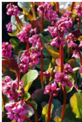
Bergenia cordifolia Eroica

Standort: Halbschattig bis schattig, frischer bis mässig frischer Boden