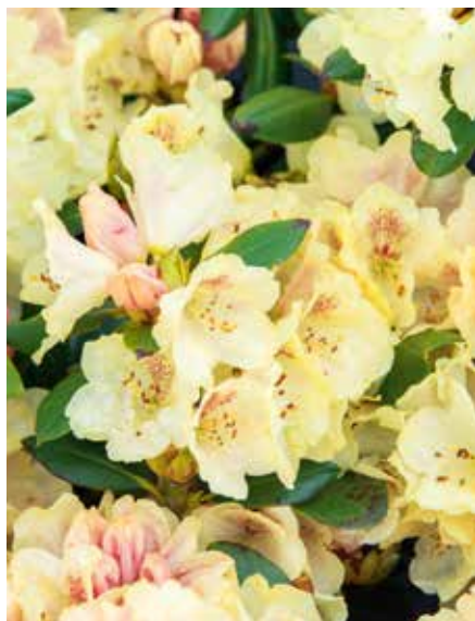
Rhododendron yakushmanum Goldprinz