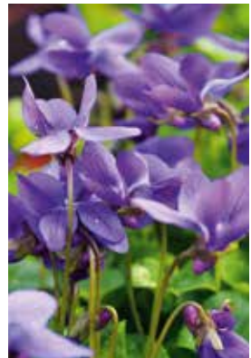
Viola odorata 'Königin Charlotte'