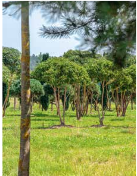
Heptacodium miconioides SOLB Schirm