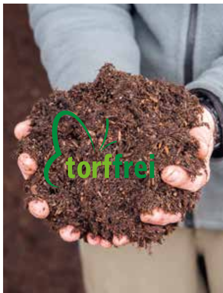
Torffrei seit 2002