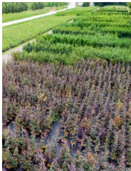
Fagus sylvatica Atropunicea