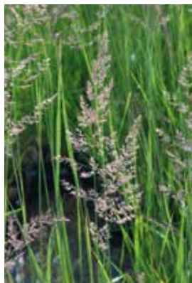
Calamagrostis acutiflora Karl Foerster

Standort: Frischer bis trockener, mässig nährstoffreicher Boden, sonnig