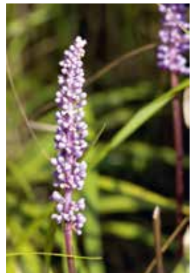
Liriope muscari Ingwersen