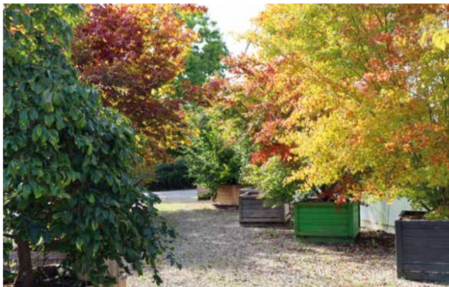
Solitärpflanzen in Holzkisten