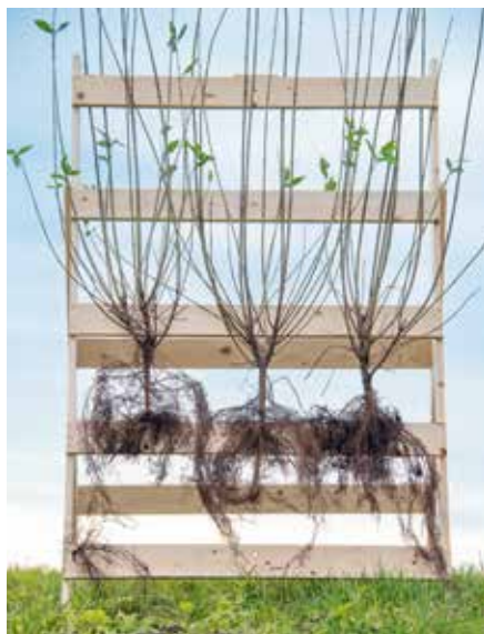
Ligustrum vulgare Atrövirens HE