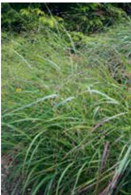
Panicum virgatum Rehbraun

Standort: Sonnig bis halbschattig, normaler Gartenboden, gut standfest