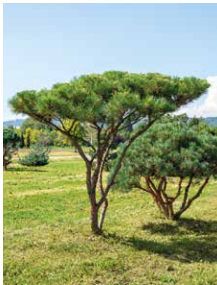
Pinus densiflora Umbraculifera SOLB Schirm