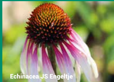
Echinacea JS Engeltje