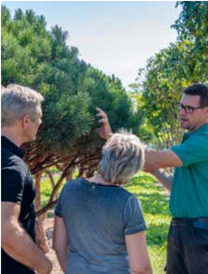
Persönliche Beratung in der Baumschule Rafz

Vereinbaren Sie einen Termin per Telefon 044 879 11 22 und geben Sie uns zur Vorbereitung vorgängig Ihre «Wunschpflanzen» an oder mailen Sie uns Ihre Pflanzenliste: info@hauenstein-rafz.ch