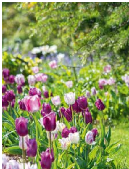
Schaugarten im Frühjahr