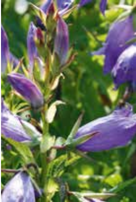
Campanula latifolia macrantha

Standort: Frisch bis zeitweise trocken, mässig nährstoffreich, mässiger Wurzeldruck