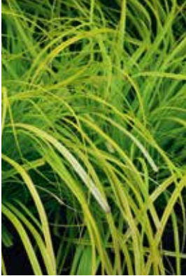
Carex oshimensis Everillo

Standort: Halbschattig bis schattig, erträgt kaum Wurzelndruck