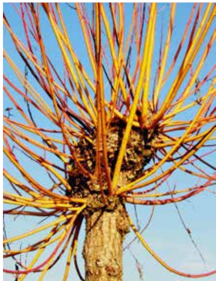
Salix alba Chermesina Kopfweide