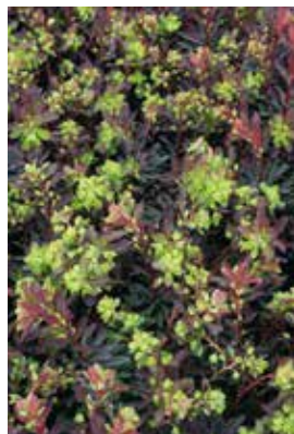
Euphorbia amygdaloides Purpurea