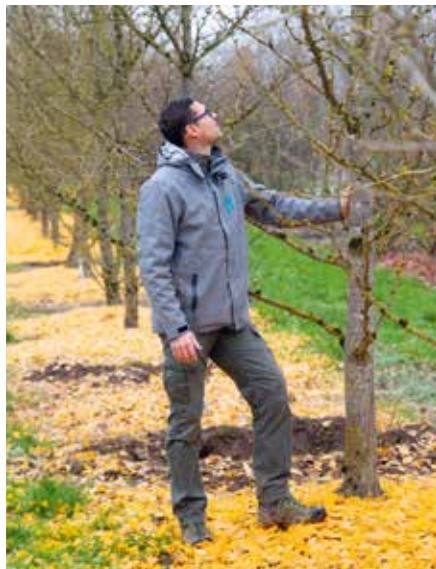
Ginkgo biloba Autumn Gold