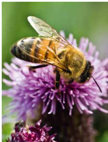
Produktion Hauenstein Baumschulhonig