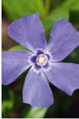
Vinca minor Marie@