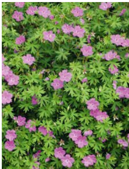
Geranium Tiny Monster