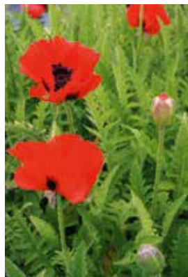
Papaver orientale Türkenlouis