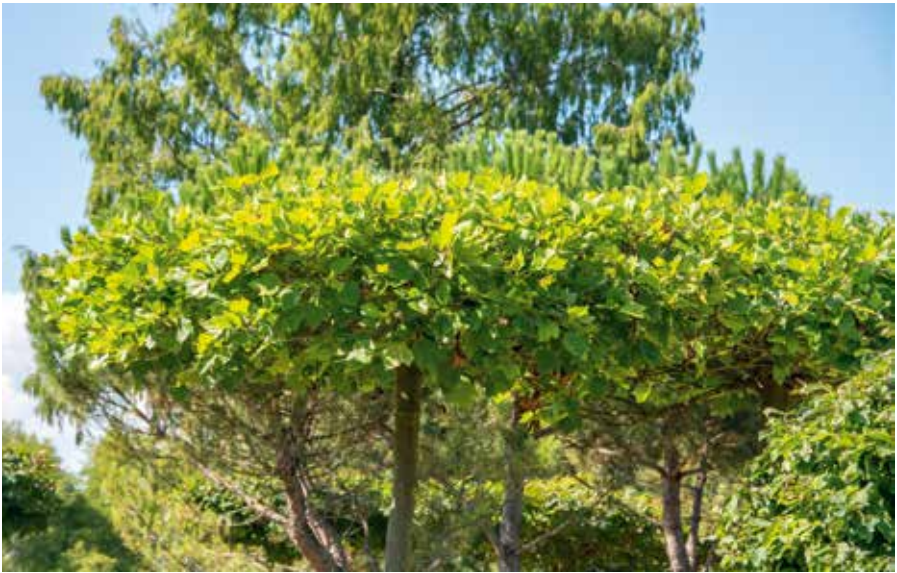
Platanus hispanica Schirm