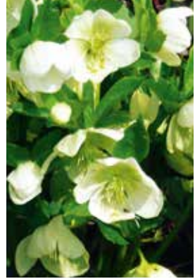
Helleborus orientalis White Lady