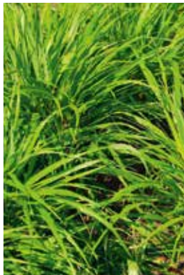
Hakonechloa macra 'Nicolas'