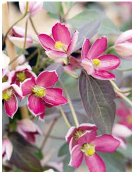
Clematis montana Van Gogh