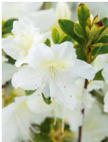
Rhododendron obtusum Schneeglanz