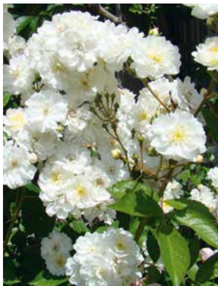
Rosa Guirlande d'Amour