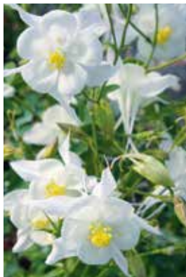
Aquilegia caerulea Kristall