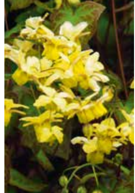
Epimedium versicolor Sulphureum