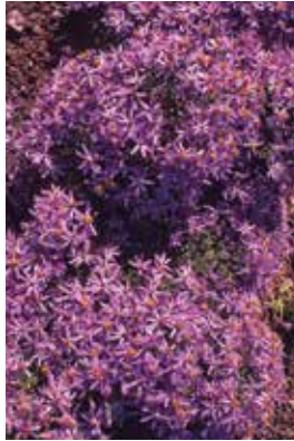
Aster sedifolius Nanus