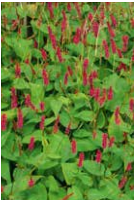
Persicaria amplexicaulis 'Blackfield®'

Standort: Halbschattig bis absonnig, frischer, nährstoffreicher Boden