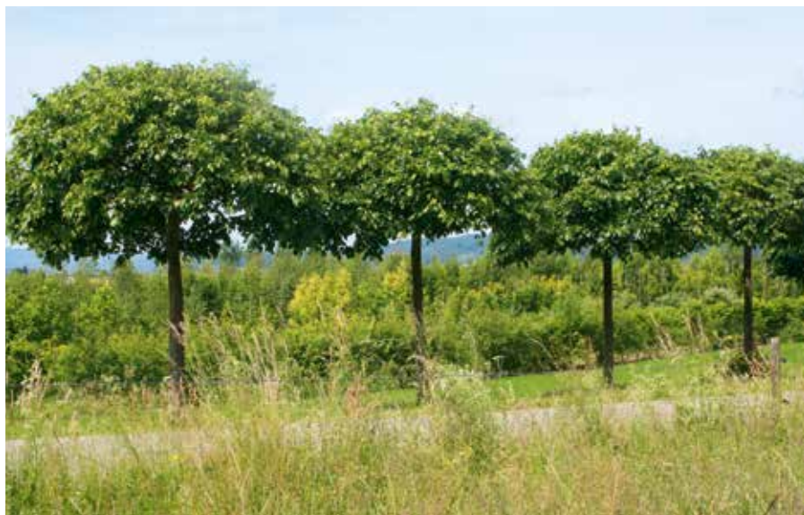
Tilia europaea Euchlora Dachform