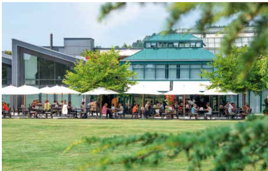
Restaurant Botanica – Platz für bis zu 120 Personen

Restaurant Botanica mit Schaugarten in Rafz