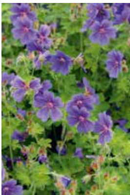
Geranium magnificum 'Rosemoor'