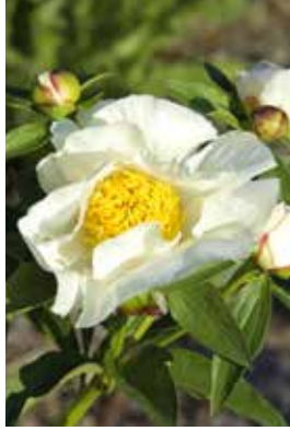
Paeonia Krinkled White