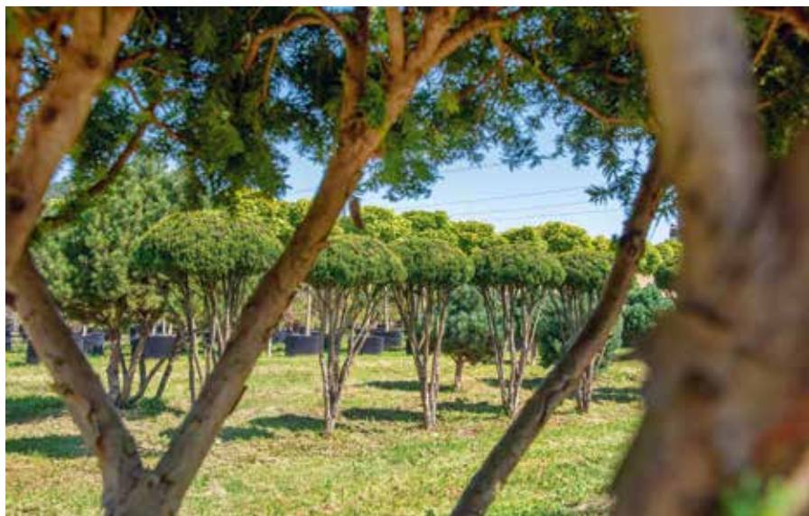
Taxus baccata SOLB Schirm