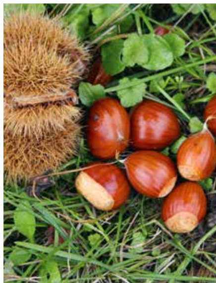
Castanea sativa Brunella