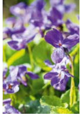
Viola odorata Königin Charlotte