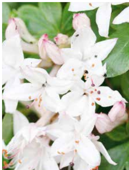
Rhododendron viscosum Sommerduft