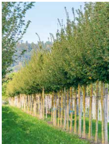
Acer campestre Elsrijk