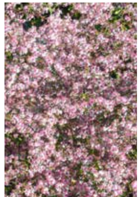
Aster Lady in Black