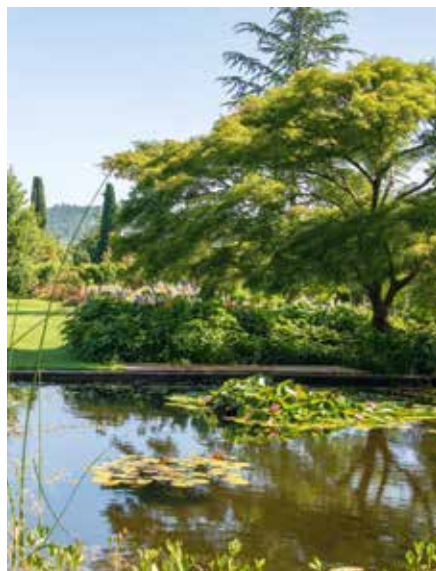
Schaugarten im Sommer