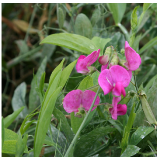
Lathyrus latifolius Red Pearl