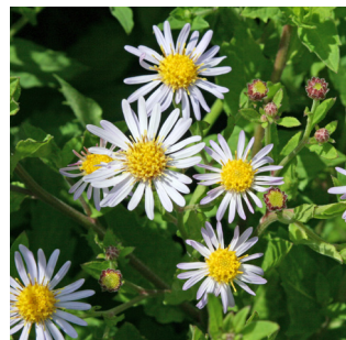
Aster ageratoides Asran