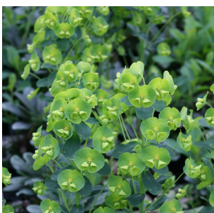
Euphorbia amygdaloides robbiae