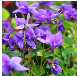
Viola odorata 'Königin Charlotte'